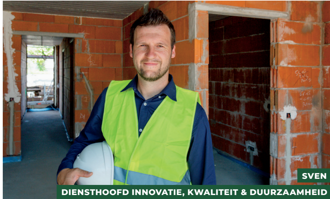
DIENSTHOOFD INNOVATIE, KWALITEIT & DUURZAAMHEID